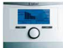
Regelung Multimatic 700